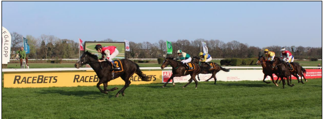
Der 3. Platz geht an Alexis Lemer (FRA) mit Tapering .