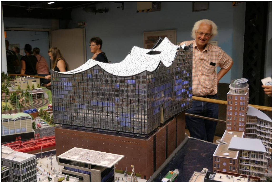
Natürlich durfte am rennfreien Montagmorgen ein Besuch in Der Speicherstadt nicht fehlen.