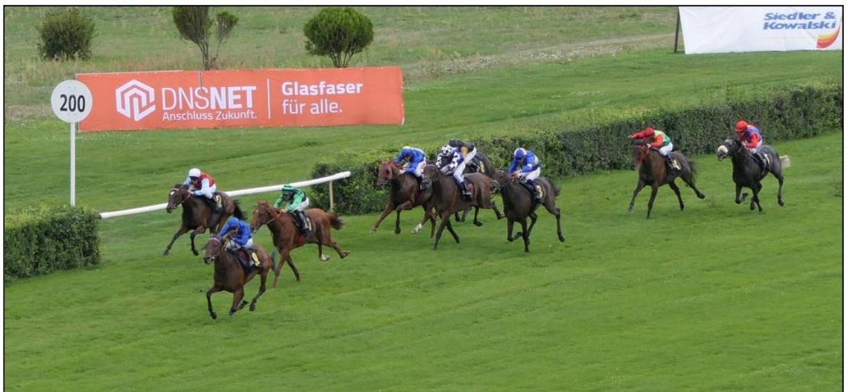
.....die kurz darauf an Julien-L. Guillochon mit Magical Touch geht.