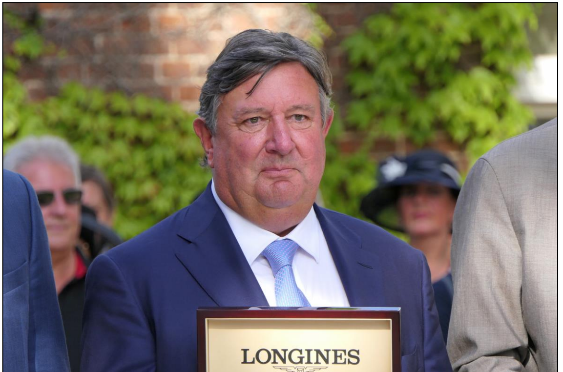
Erfolgstrainer Henri-Alex Pantall aus Frankreich