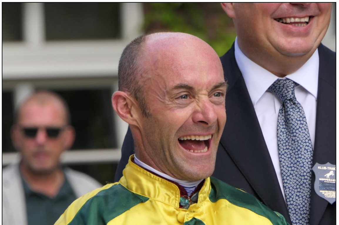
Bei einem Sieg auf einer so schönen Rennbahn wie in Berlin-Hoppegarten, da kommt Freude auf.