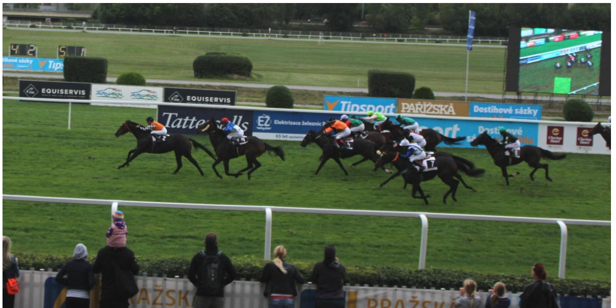
Katerina Hlubuckova führt mit Bourka ca. 100 Meter vor dem Ziel das Rennen an und....