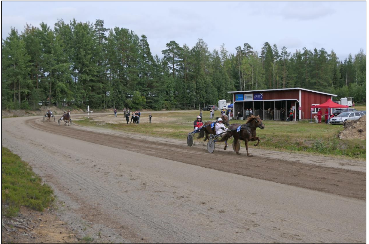
...Mitte der kurzen Geraden...