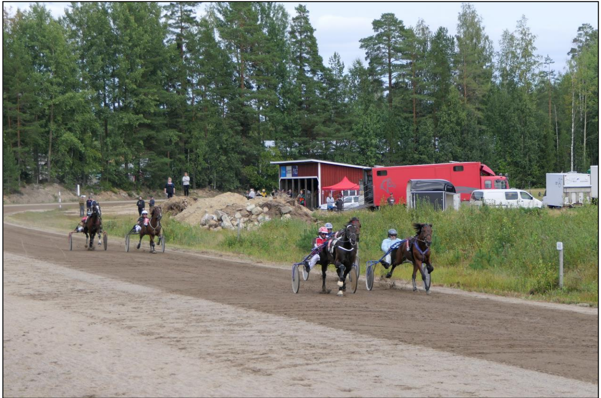
Start, ein Startauto existiert hier nicht.