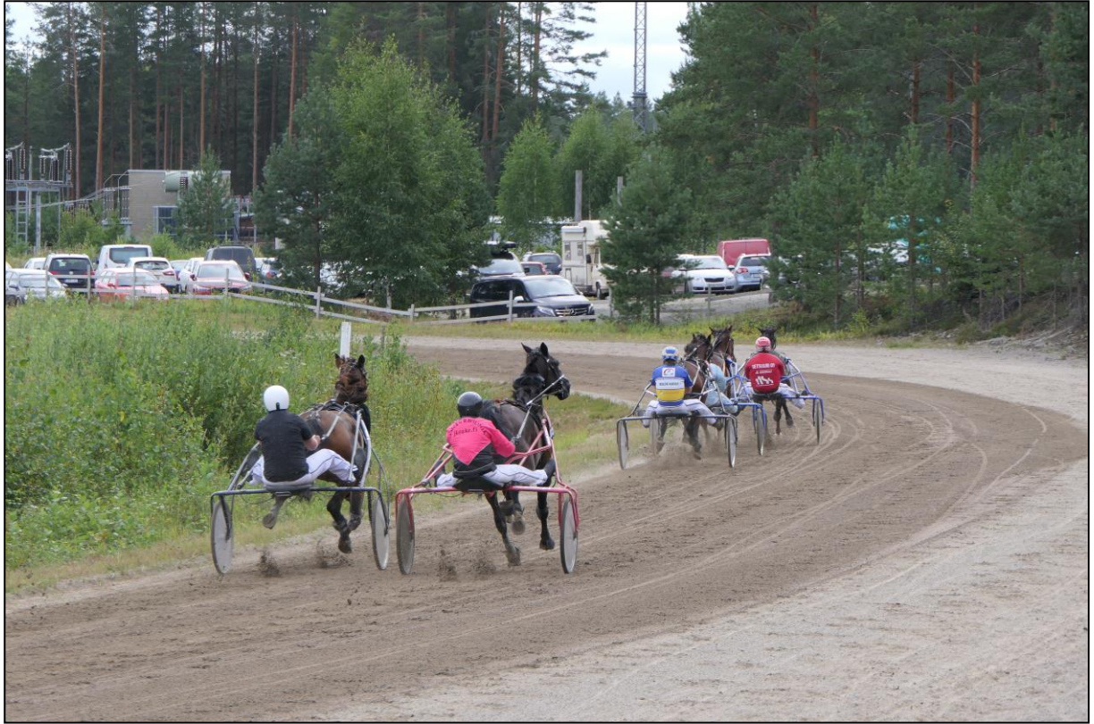
Die Pferde im ersten Bogen...