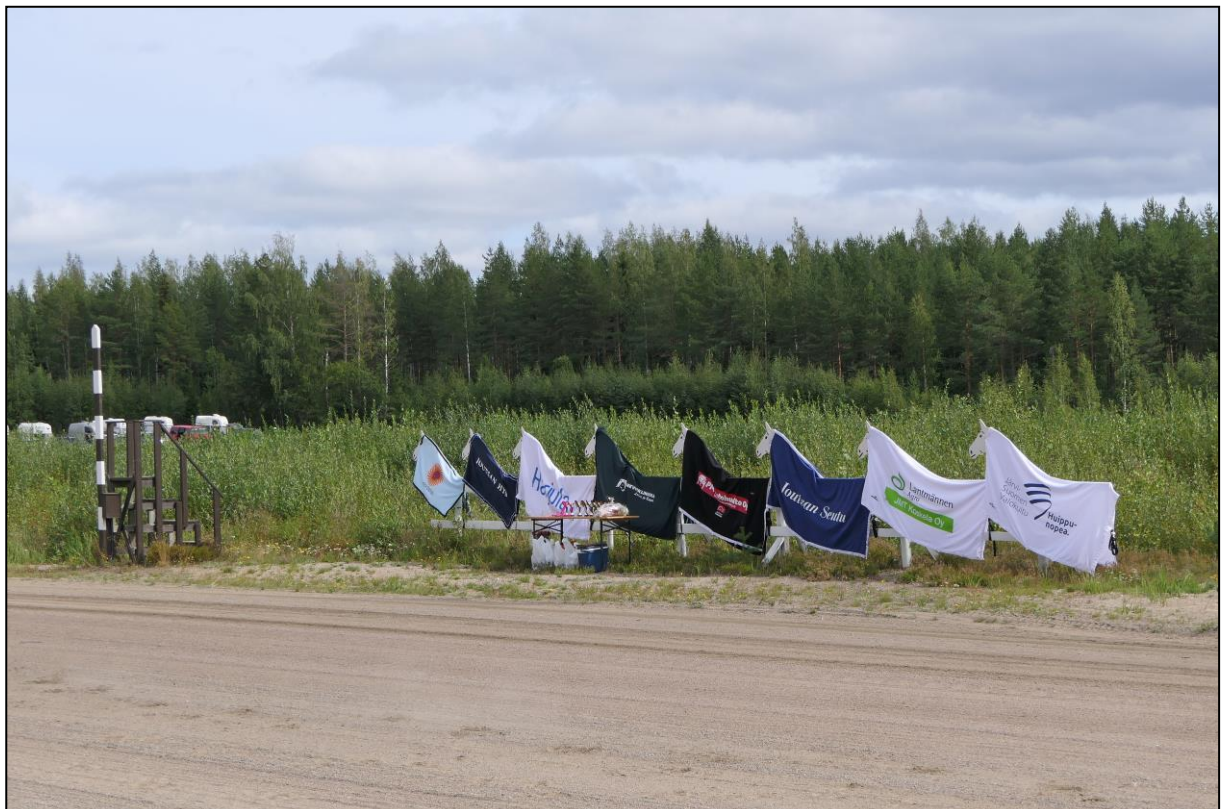
Pferdedecken und Sachpreise gibt es reichlich.