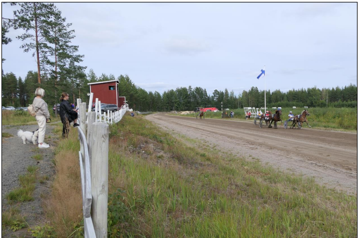
Das Feld hinter dem Zielposten, die zweite Runde wird in Angriff genommen.