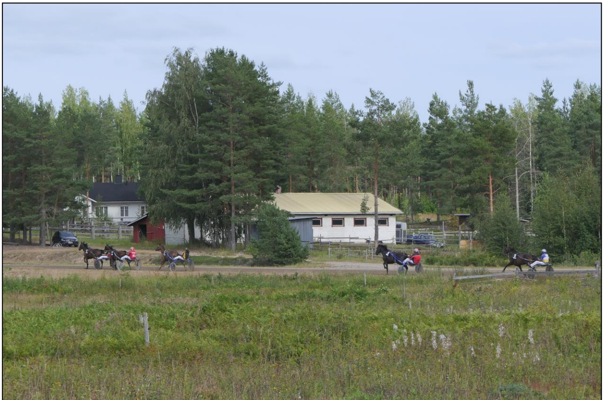
... in der Gegenseite...