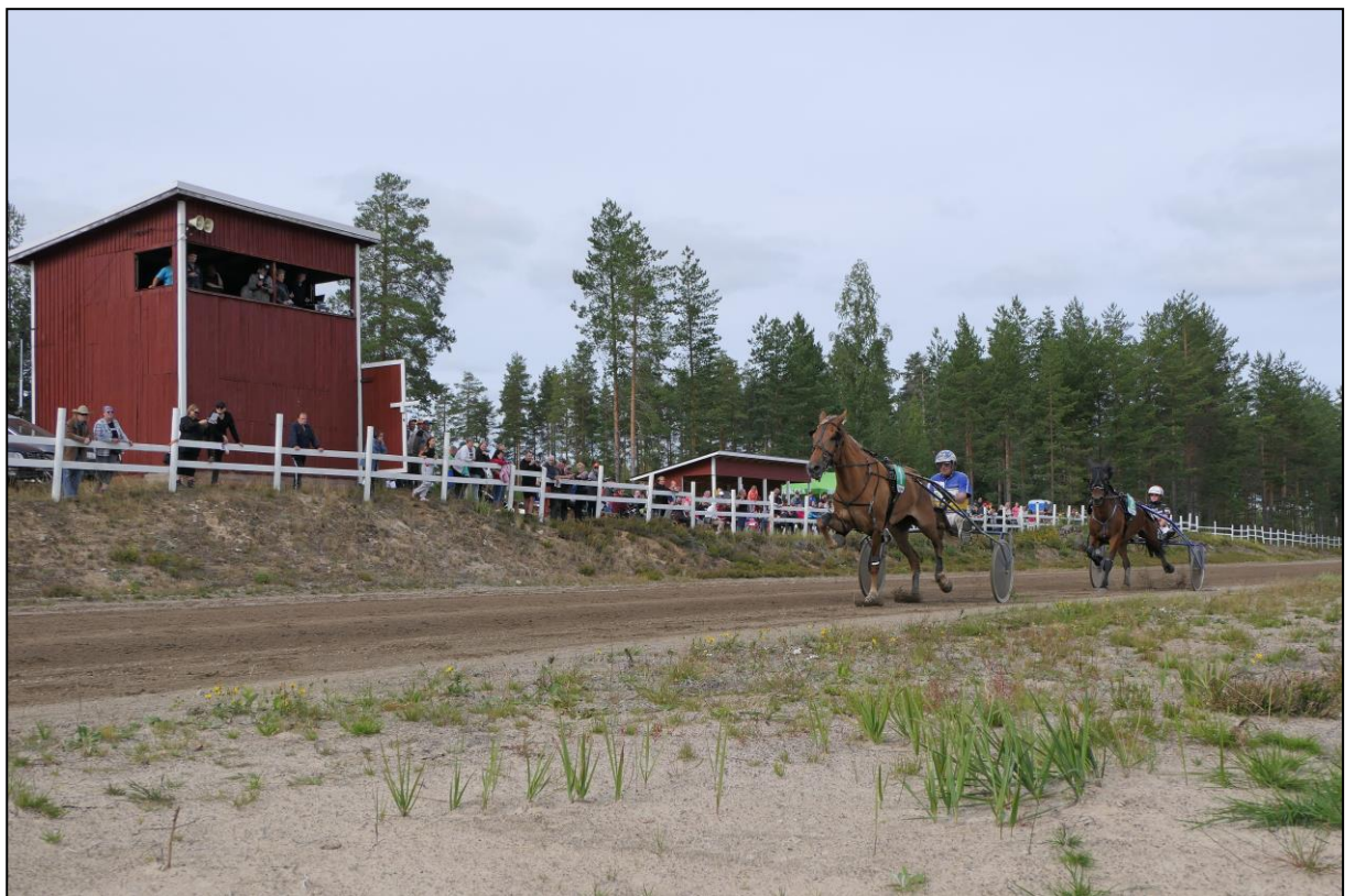
...und kurz vor dem Pfosten