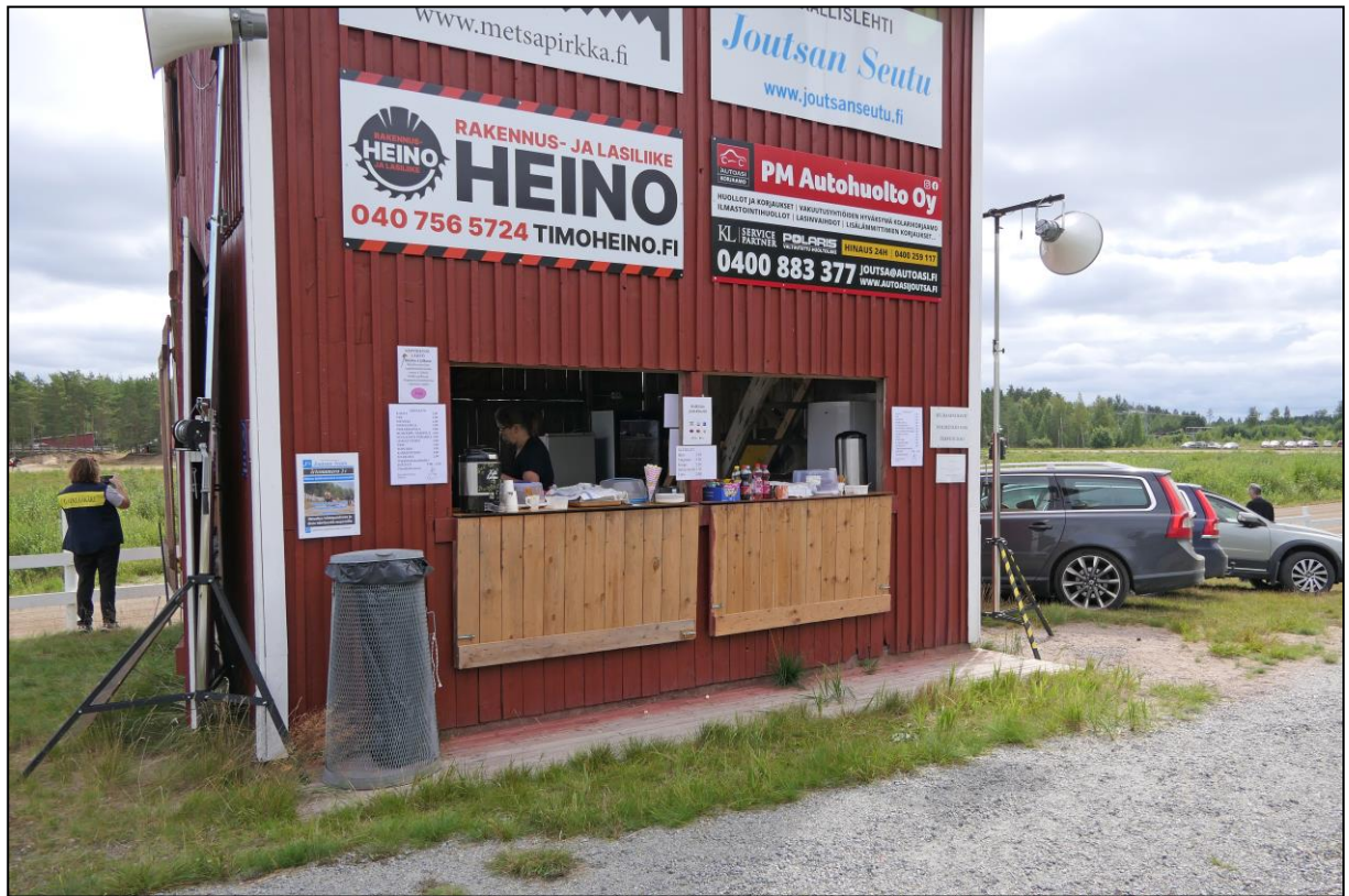
Die Gastronomie ist im unteren Teil des Zielrichterturmes angesiedelt.