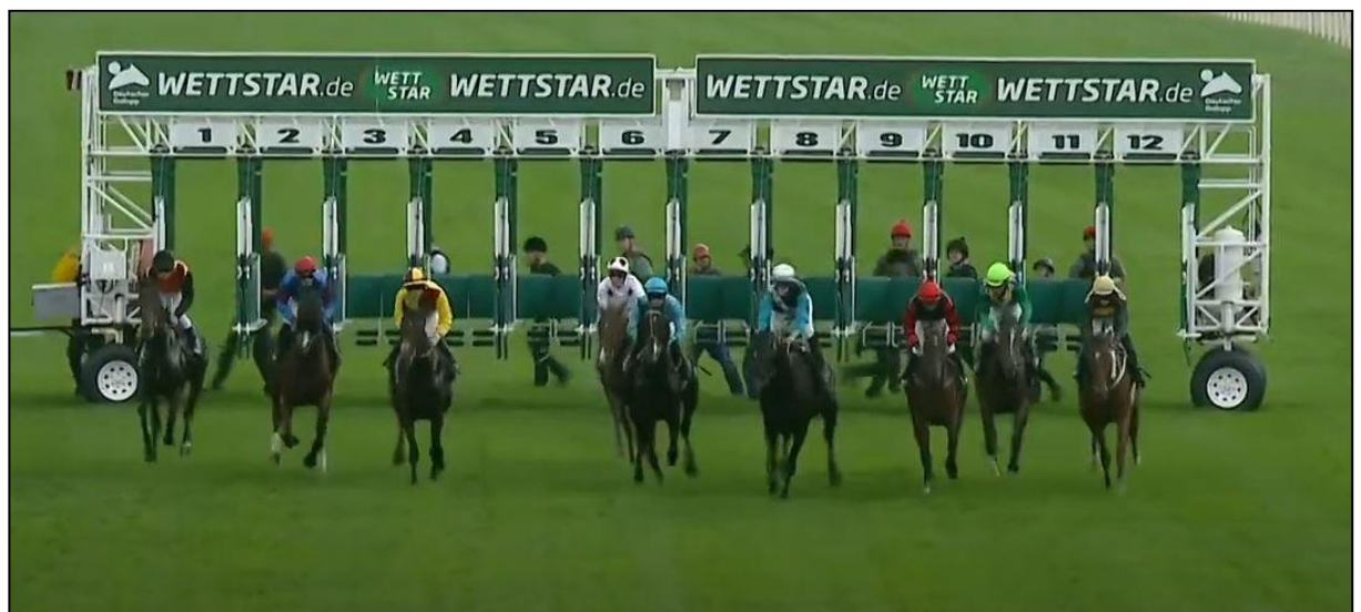
Beim Start des neunköpfigen Feldes sieht man die tschechische Paarung (am Toto als größter Außenseiter gewettet) ganz rechts.