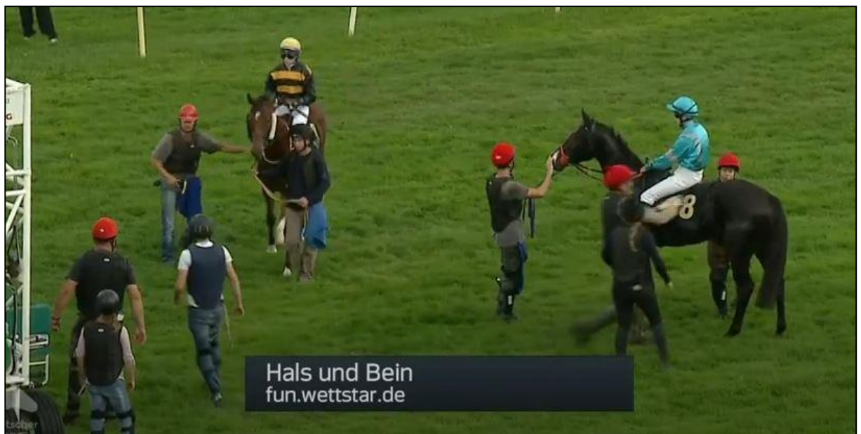
Nur noch zwei Pferde außerhalb.